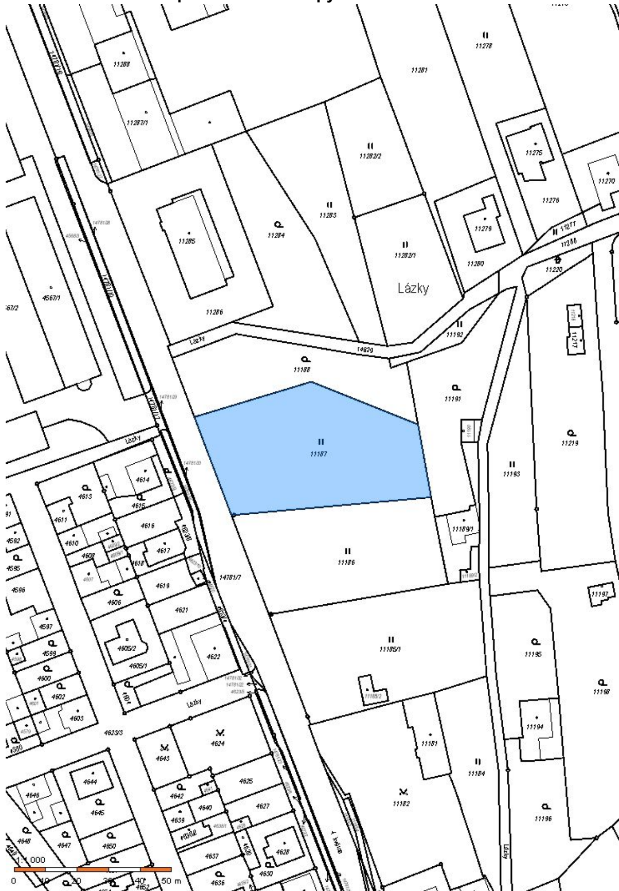
Pozemek p.č. 11187 v k.ú. 786764