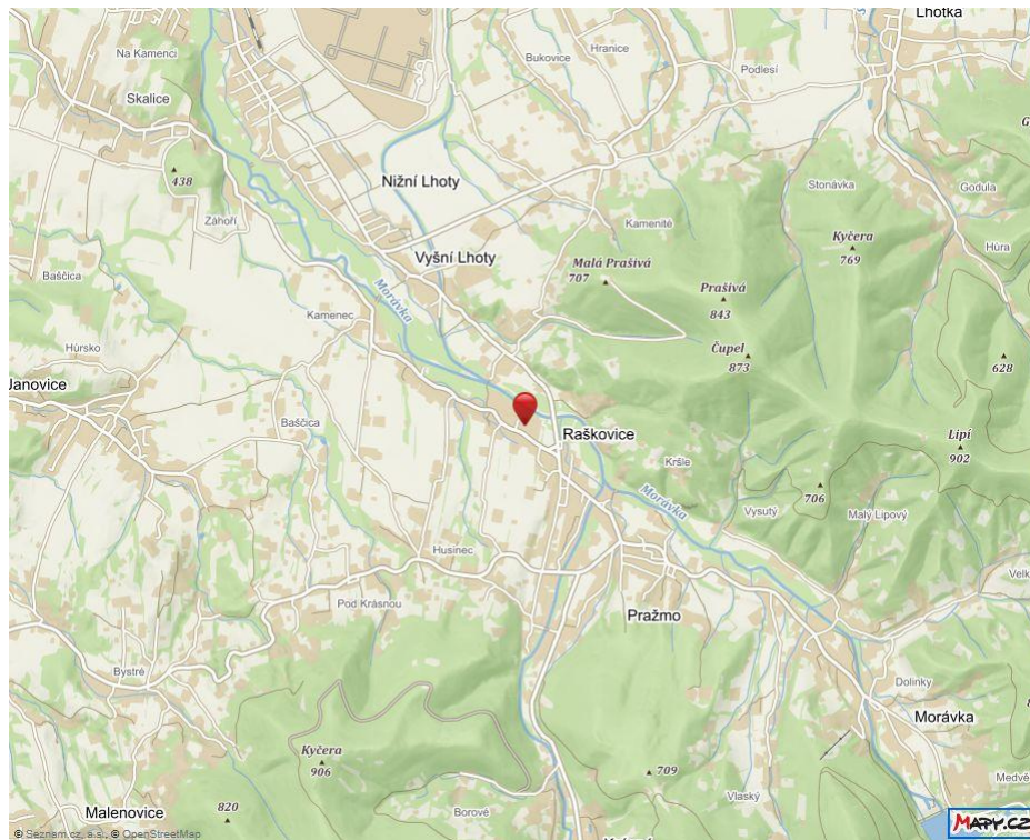
Pozemek p.č. 245 v k.ú. č. 739502 Kopie katastrální mapy ze dne 9.3.2018